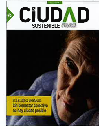
06 Redes, señales y espacios para combatir la soledad no deseada