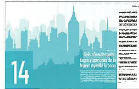
14 SEIS AÑOS DESPUÉS: LUCES Y SOMBRAS DE LA NUEVA AGENDA URBANA