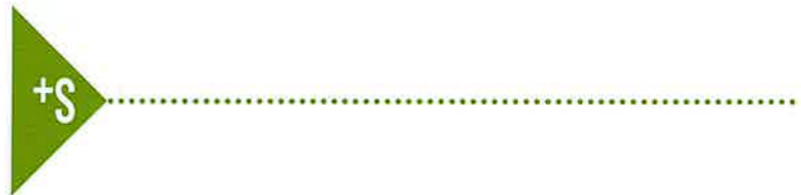
76 +S AGUA Aqualia reduce su huella de carbono y recibe el Sello 'Reduzco'