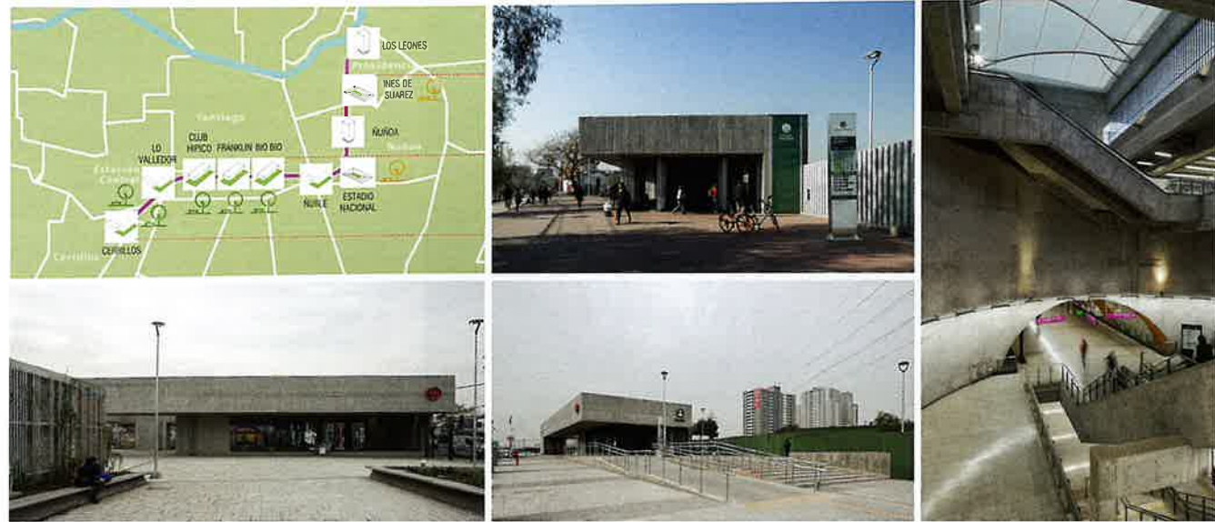
Estaciones de la Línea 6 de Metro de Santiago. Estrategias de implantación de los accesos en función del contexto urbano en el que se sitúan las estaciones; parques existentes, nuevas plazas de acceso o áreas de desarrollo consolidado.