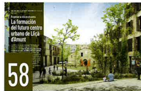
58 PROYECTAR LA VIDA EN EL CENTRO. LA FORMACIÓN DEL FUTURO CENTRO URBANO DE LLIÇÀ D'AMUNT