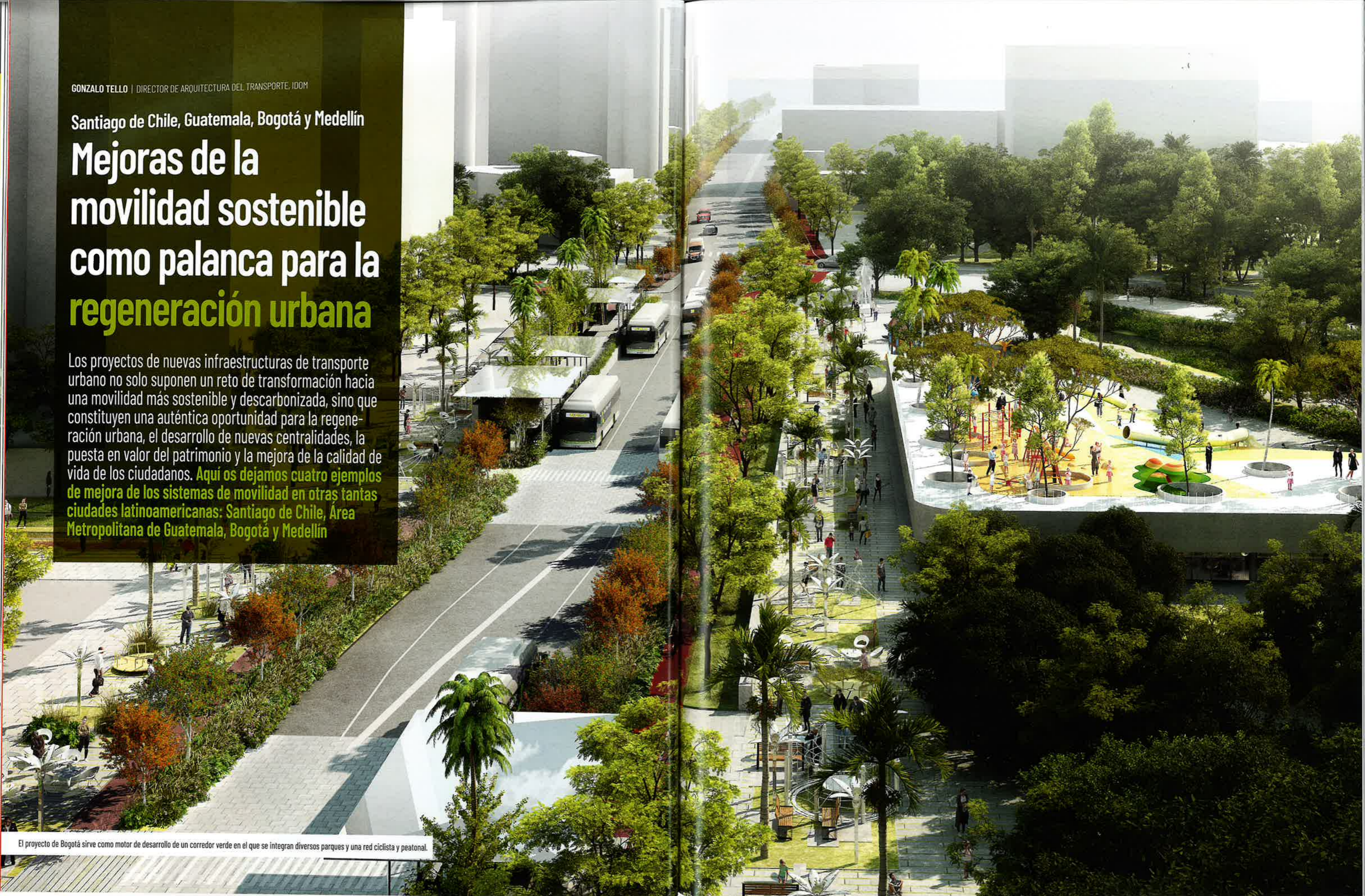
El proyecto de Bogotá sirve como motor de desarrollo de un corredor verde en el que se integran diversos parques y una red ciclista y peatonal.

Los proyectos de nuevas infraestructuras de transporte urbano no solo suponen un reto de transformación hacia una movilidad más sostenible y descarbonizada, sino que constituyen una auténtica oportunidad para la regeneración urbana, el desarrollo de nuevas centralidades, la puesta en valor del patrimonio y la mejora de la calidad de vida de los ciudadanos. Aquí os dejamos cuatro ejemplos de mejora de los sistemas de movilidad en otras tantas ciudades latinoamericanas: Santiago de Chile, Área Metropolitana de Guatemala, Bogotá y Medellín