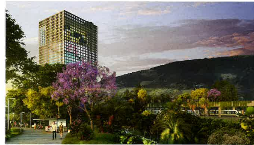
El proyecto de Cocheras de Metro de Medellín supone una oportunidad para la creación de un nuevo parque urbano.

El Corredor se concibe como un Ecotono, como el espacio de cohabitación entre el ecosistema de los Cerros Orientales de Bogotá y el ecosistema urbano que la propia ciudad representa. Ambos coexisten en la Carrera Séptima y dan lugar a un espacio híbrido donde conceptos como la biodiversidad, conectividad ecológica o el paisaje