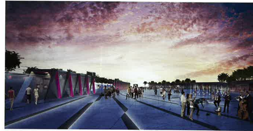
Imagen de la estación central de MetroRiel, Guatemala.

La línea 6 atraviesa la ciudad de este a oeste conectando dos lados muy distintos en cuanto a la calidad del espacio urbano y desarrollo económico. Las estaciones deben