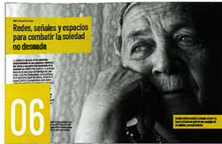
06 REDES, SEÑALES Y ESPACIOS PARA COMBATIR LA SOLEDAD NO DESEADA