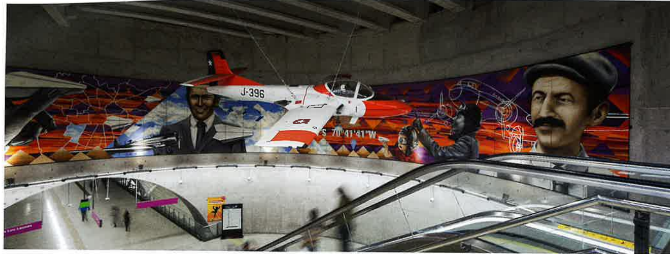
La incorporación de espacios culturales en las estaciones es una característica en la red de Metro de Santiago. Estación Cerrillos cuyo mural e instalación la relaciona con el Museo Nacional de la Aviación próximo a la misma.

La creación de nuevas redes de transporte urbano contribuye al reequilibrio económico y social de la ciudad, promoviendo la igualdad de oportunidades de sus habitantes y conectando áreas con distintos índices de desarrollo.