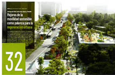
32 SANTIAGO DE CHILE, GUATEMALA, BOGOTÁ Y MEDELLÍN: MEJORAS DE LA MOVILIDAD SOSTENIBLE COMO PALANCA PARA LA REGENERACIÓN URBANA