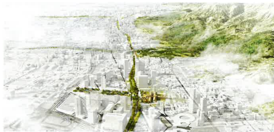
El proyecto de la Carrera Séptima en Bogotá supone la oportunidad de la creación de un gran corredor verde y la creación de nuevos espacios públicos en la ciudad.

El Estado de Guatemala y las municipalidades del Área Metropolitana están tomando medidas para revertir el problema diario de congestión en sus vialidades, entre ellas la generación de nuevos sistemas de transporte público en los principales corredores. Aprovechando el antiguo trazado de la línea ferroviaria entre los principales puertos del Atlántico y el Pacífico, se busca