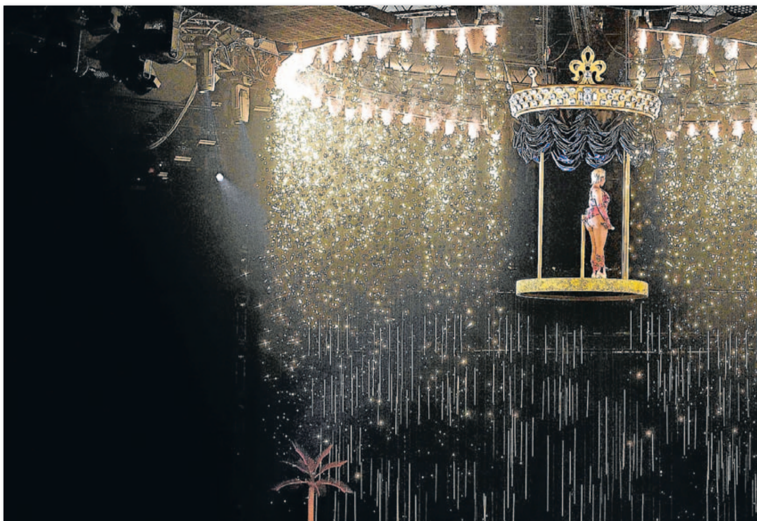
Arriba, los premios MTV de 2018. A la derecha, el Mundial de Basket de 2014 y una edición de la Bienal. Abajo, la presentación de los vehículos MAN en 2020.

Enhorabuena a BEC por este 20 aniversario y nuestros mejores deseos de futuro. Zorionak BEC hogeitau urte hauetan lortutako guztiagatik.